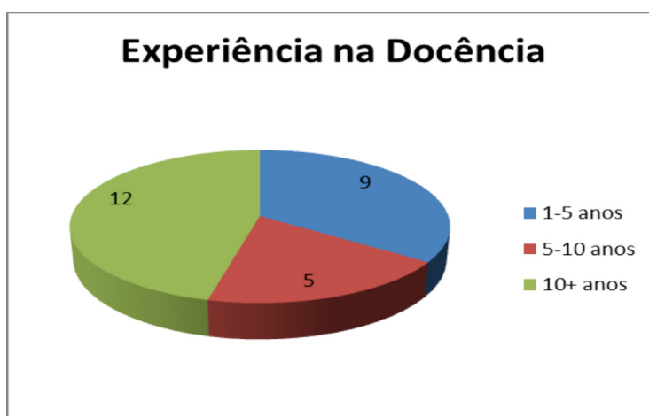
Gráfico 2 – Experiência na docência

No gráfico 2, que apresenta as informações sobre o tempo de profissão docente, podemos visualizar que a maioria do corpo docente, doze professores, possui mais de dez anos de atuação docente. Somando-se aos cinco que têm entre cinco e dez anos de profissão docente, podemos afirmar que 65% dos professores já passou da fase de entrada, encontrando-se a maioria nas fases de diversificação ou serenidade, conforme classificação de Huberman (2007).