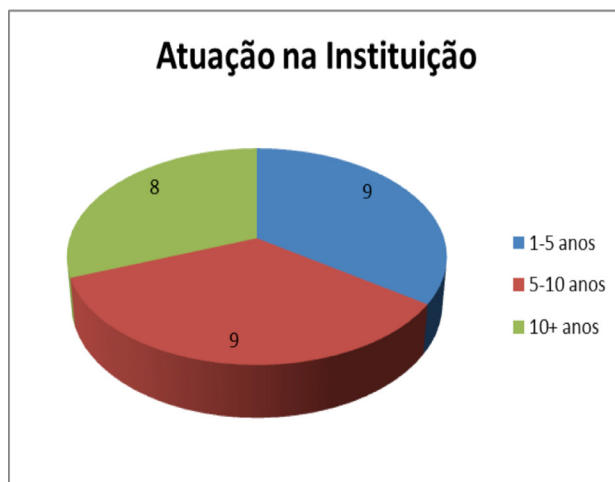
Gráfico 3 – Tempo de atuação na instituição

um a cinco anos, cinco e dez anos e dez anos ou mais. Neste ponto, voltamos a ressaltar que os CST abordados nesta pesquisa ainda não possuem dez anos de atividades nesses cursos, já que estas foram iniciadas no ano de 2005. Dessa forma, os professores com mais de dez anos na instituição atuavam em outros segmentos da educação profissional.